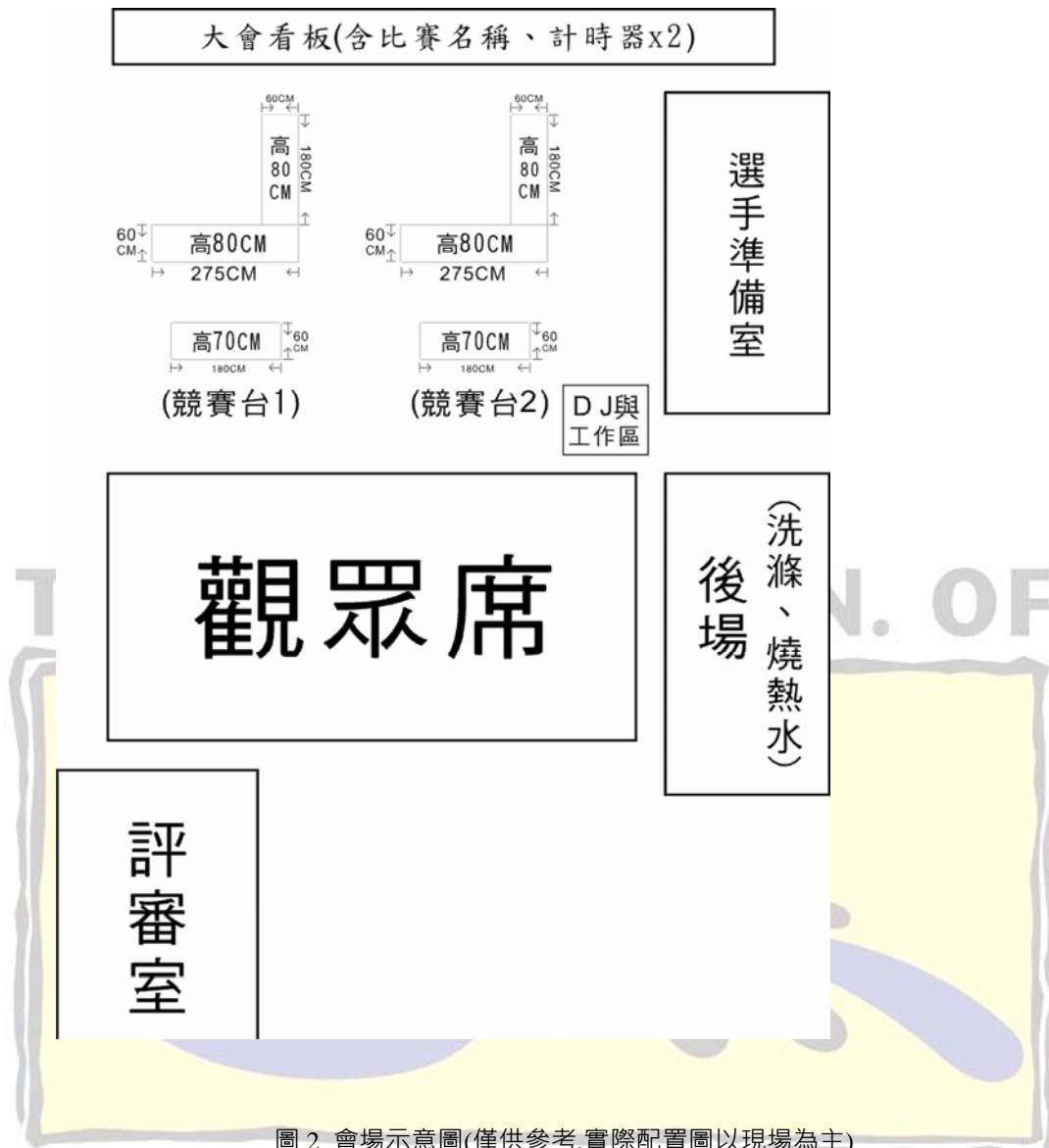
圖 2 會場示意圖(僅供參考,實際配置圖以現場為主)